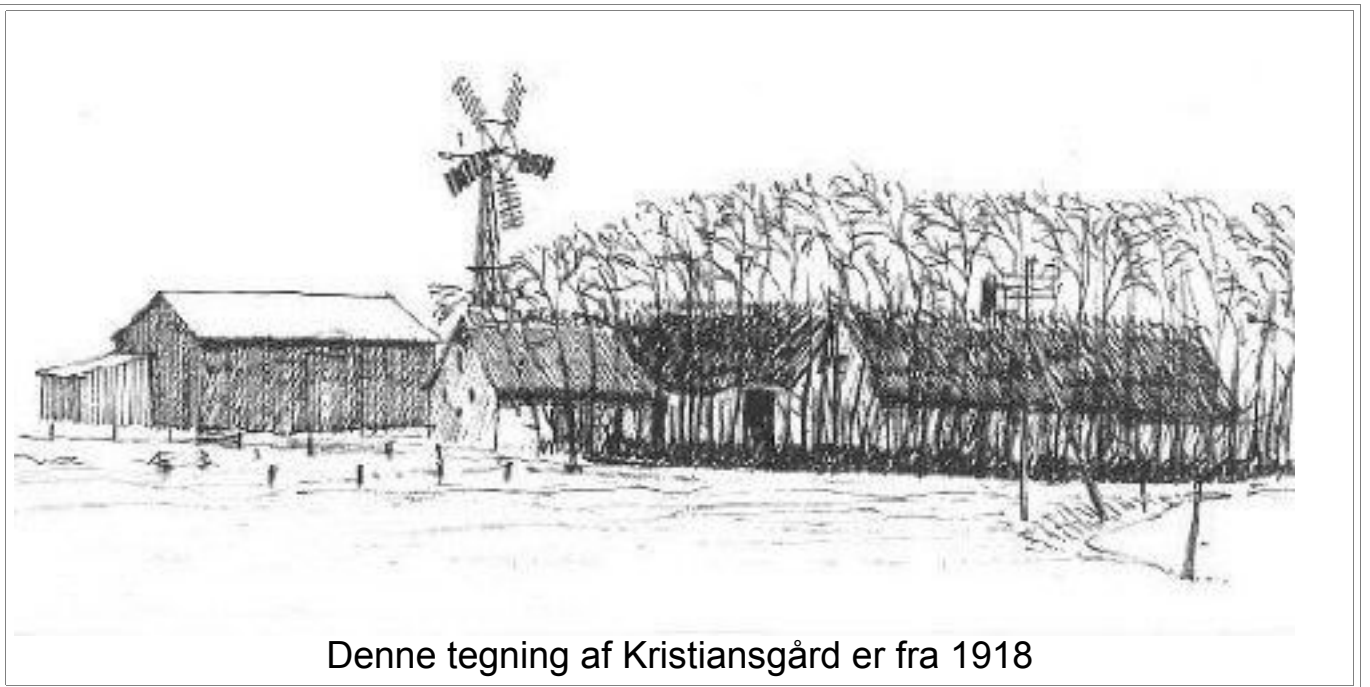
Denne tegning af Kristiansgård er fra 1918