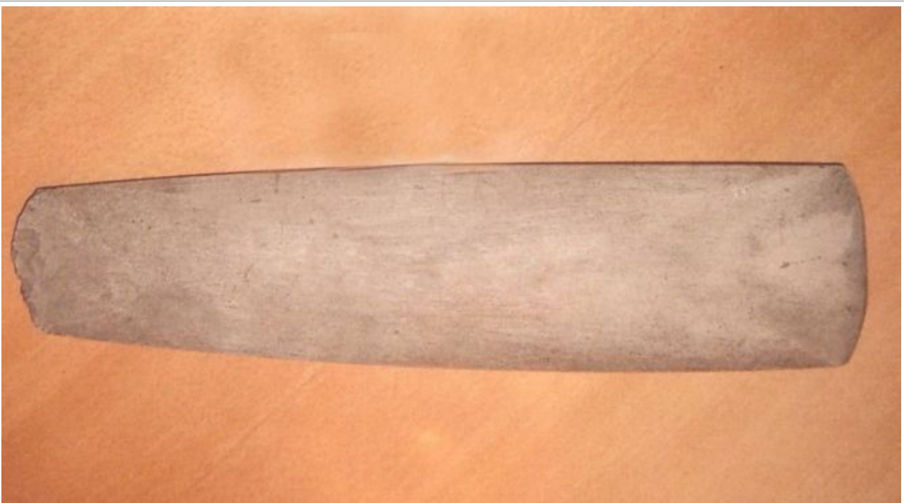
Her ses den største og flotteste af de stenøkser, som far fandt derude på jorden ved Store Bælt

Som jeg tidligere har nævnt, var far glad for at være bilist. Her foroven ses den bil, som han ejede da jeg blev født i 1938, samt hans sidste bil, som han ejede da han døde i 1960.