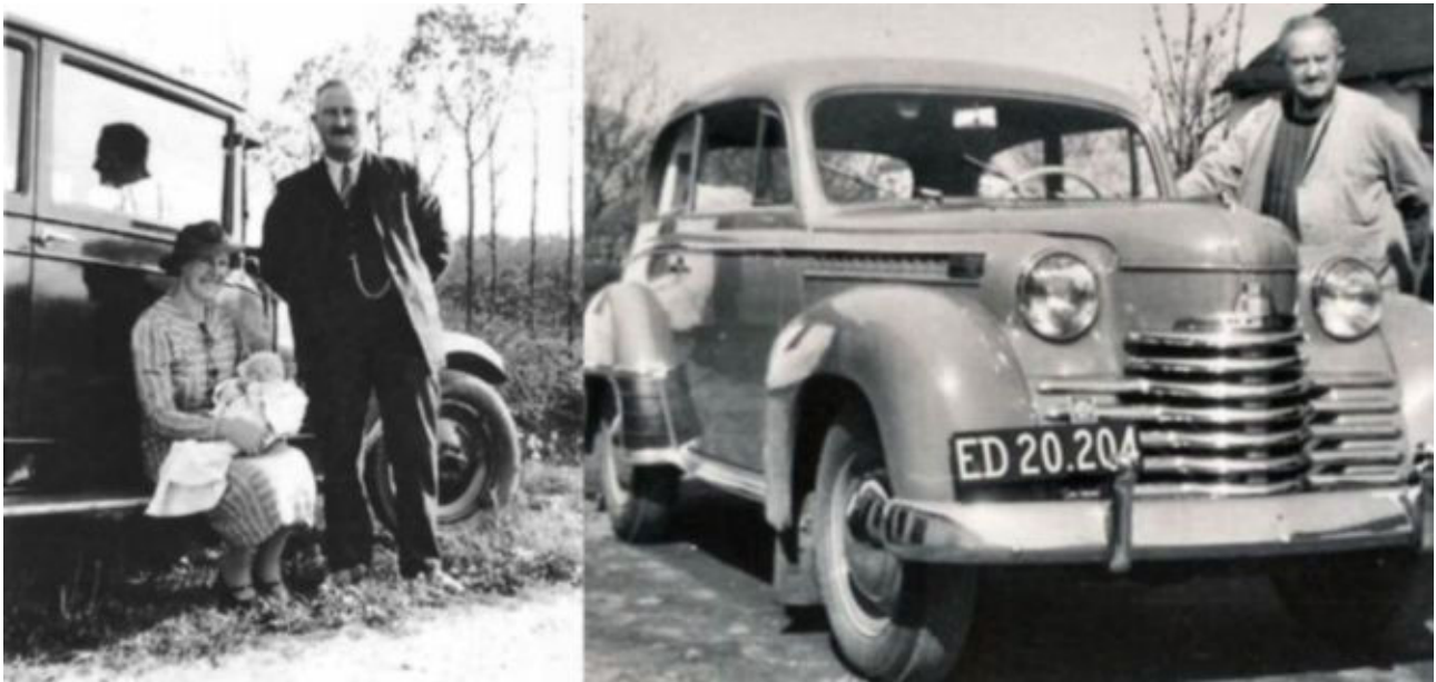
1. Far og mor ved bilen i 1938 med den nye Mogens 2. Far med den nye bil: Opel Olympia

Som jeg tidligere har nævnt, var far glad for at være bilist. Her foroven ses den bil, som han ejede da jeg blev født i 1938, samt hans sidste bil, som han ejede da han døde i 1960.