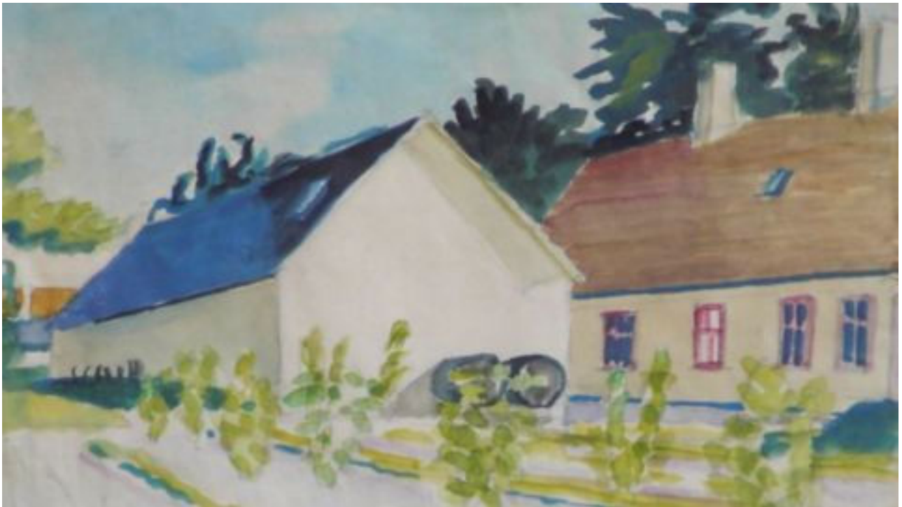
Købmandsforretningen i Rye – Akvarel af Eyvind Olesen fra 1949

Så skete der det, at Peder ville tilbage til gården, som han havde bortforpagtet. Forretningen i Øster Stillinge blev solgt, og vi rejste til Svallerup. Men her blev vi ikke ret længe, for nu savnede far livet som købmand. Han solgte da gården i 1944 og købte en købmandsforretning i Rye ved Gørlev.