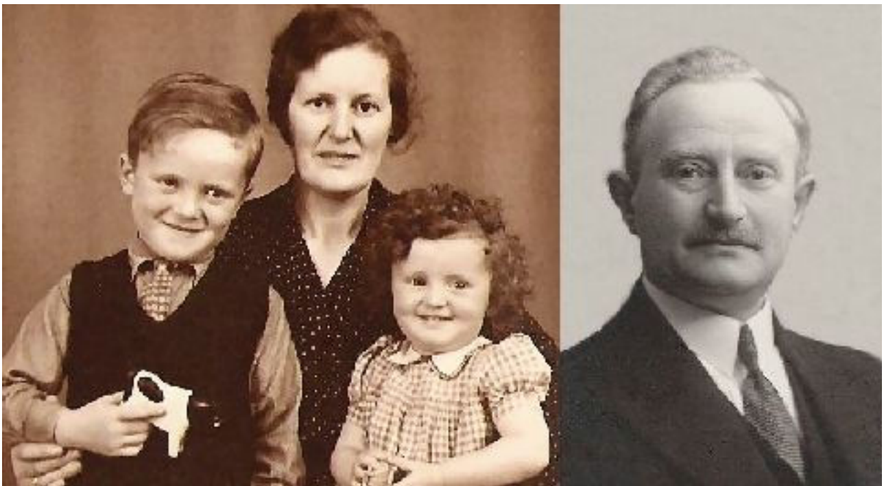
Fotos af den lille familie fra den første tid i Rye

Det er jo først her fra tiden i Rye, at jeg husker noget om, hvad der skete. Far lod til at trives med at være købmand. Og vi andre trivedes også. Jeg begyndte at gå i skole i 1945. Det var i Rye skole, der lå nogle få huse fra, hvor vi boede.