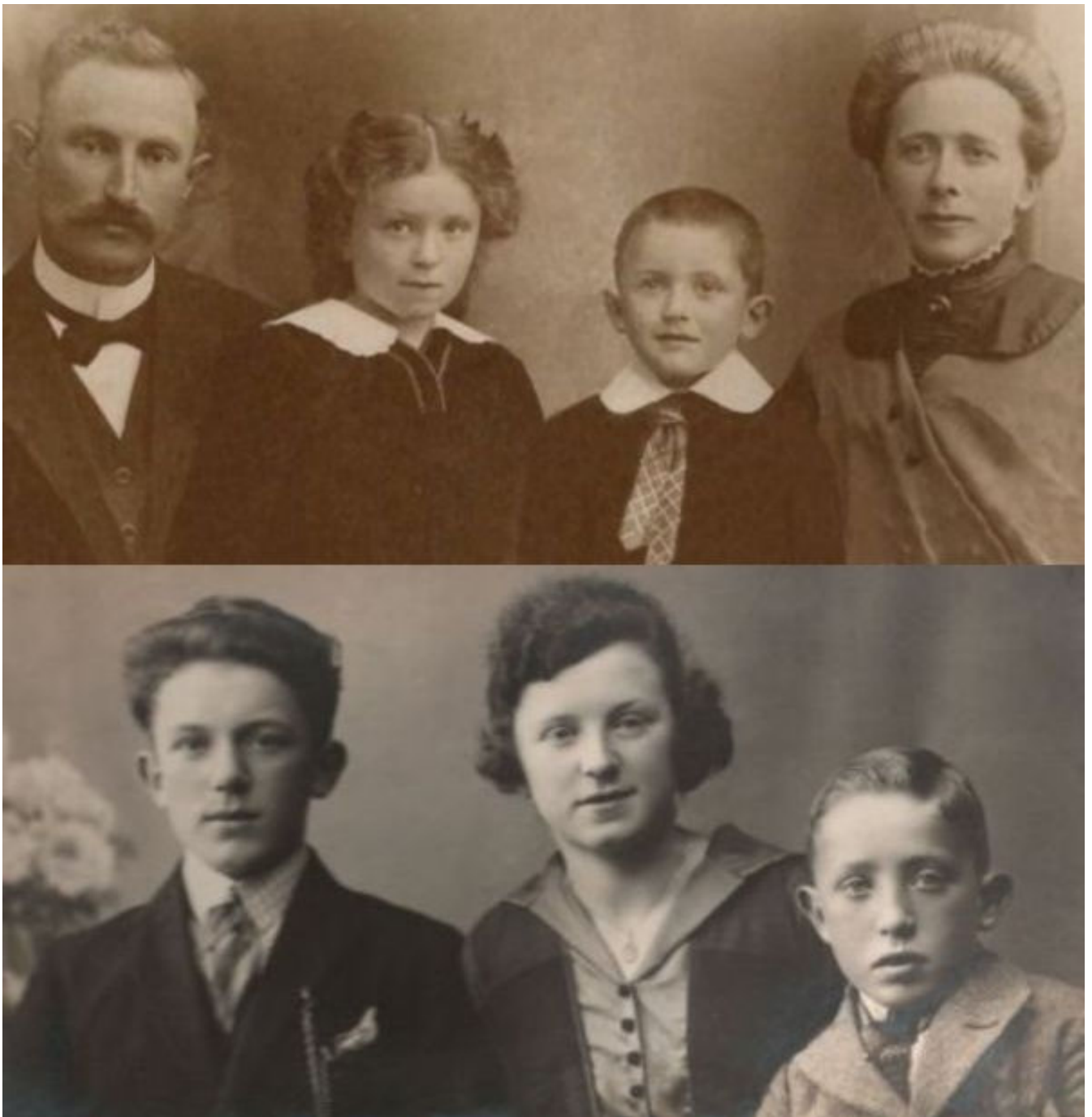
1. Familien på Jødelandsgård. 2. Børnene på Myrdalsgård nogle år senere.