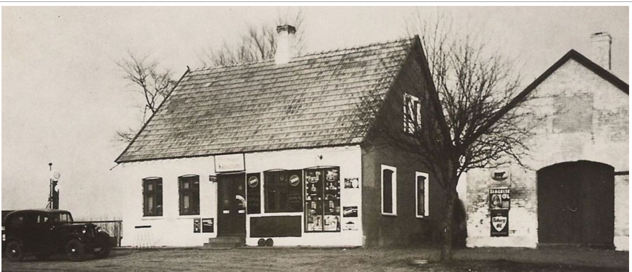
Købmandsforretningen i Øster Stillinge, familiens hjem fra 1937 -1943